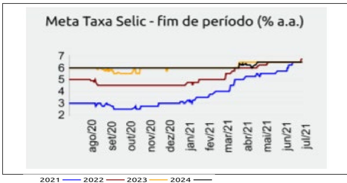
Figura 4: Projeções da Taxa de Juros Selic (% a.a.)