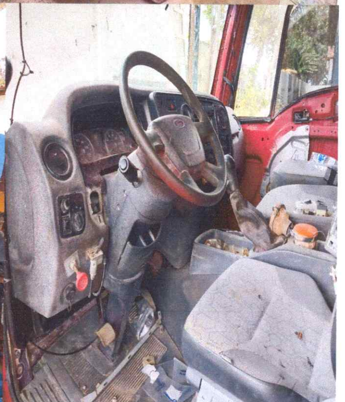
LOTE 02- FORD/CARGO 2429, PLACA OYN 6416.