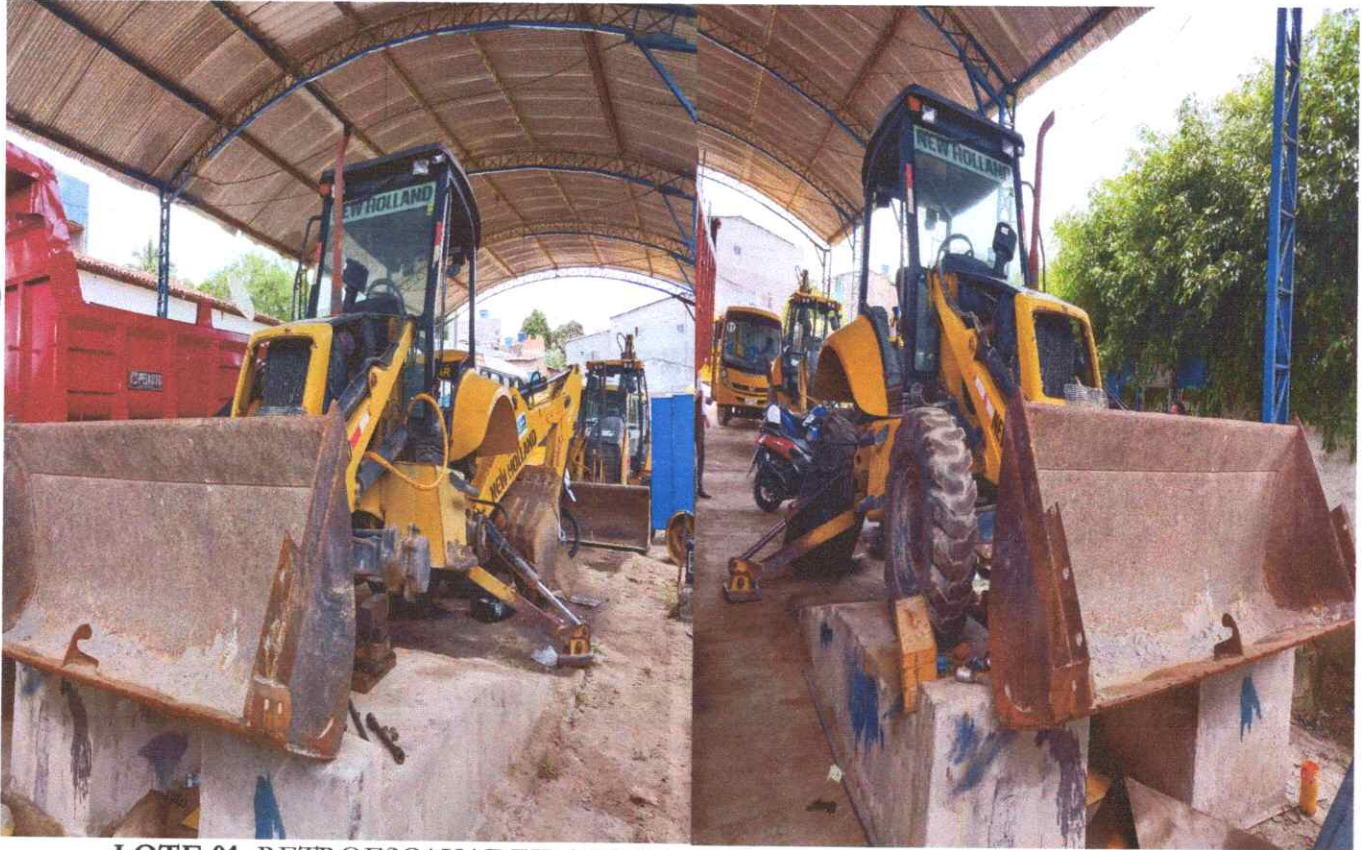
LOTE 01- RETROESCAVADEIRA NEW HOLLAND LB 99.