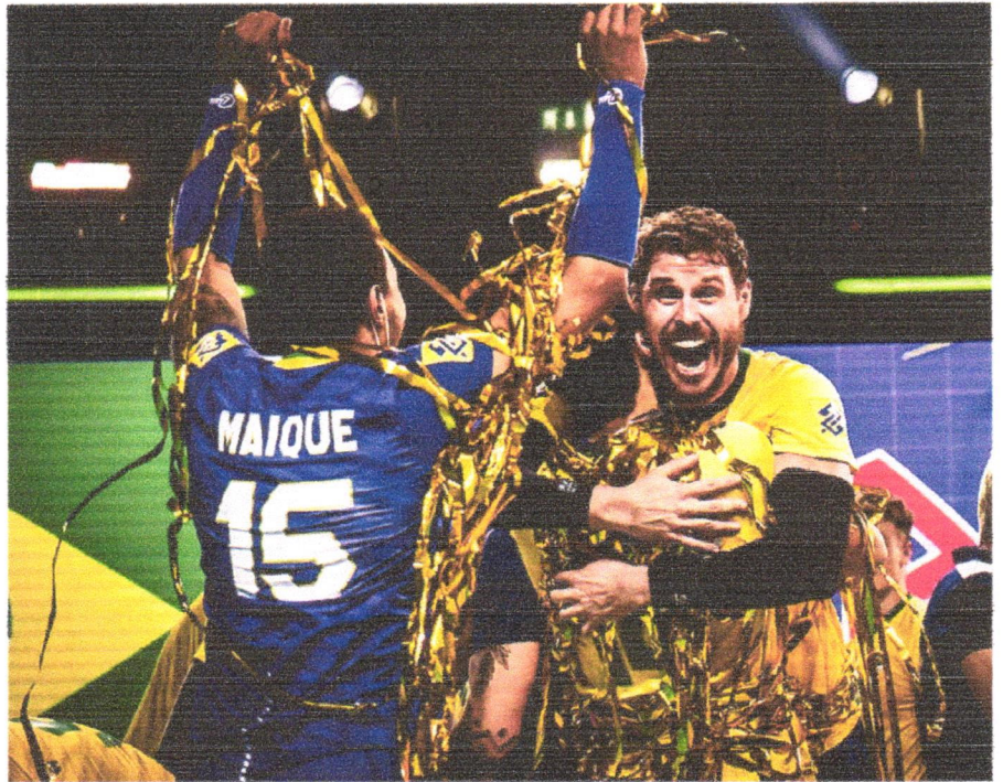
Em reencontro com a Polônia, Brasil vence por 3 sets a 1 chegará em Tóquio com a confiança em alta

■ Seleção brasileira masculina de vôlei derrota Polônia e amplia extensa galeria de troféus com título inédito conquistado na Itália